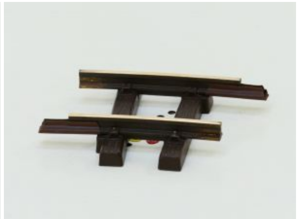
LGB 11040 Gebogenes Gleis, R1,7.5 Grad