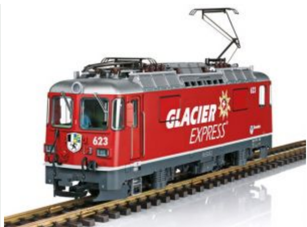
LGB 28446 Elektrolokomotive Ge 4/4 II