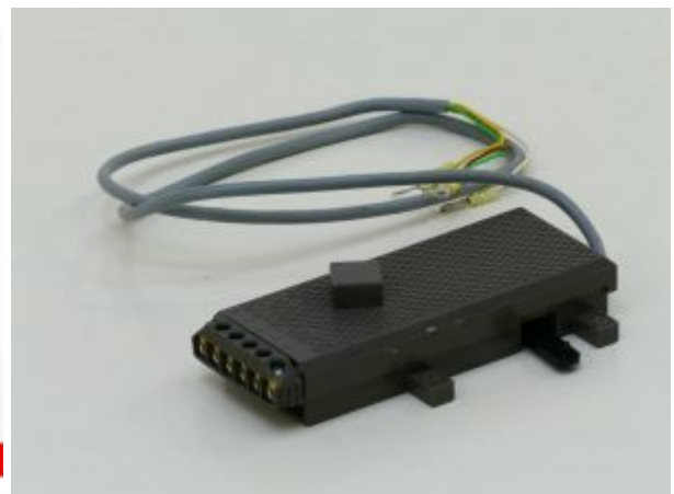
LGB 1208 AZB wissel / sein aandrijving