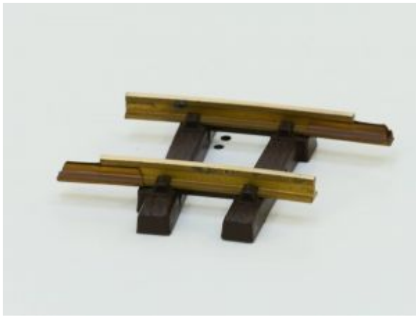
LGB 11040 Gebogenes Gleis, R1,7.5