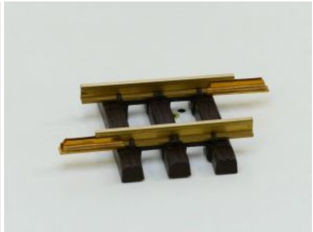
LGB 10070 Gerades Gleis, 75mm