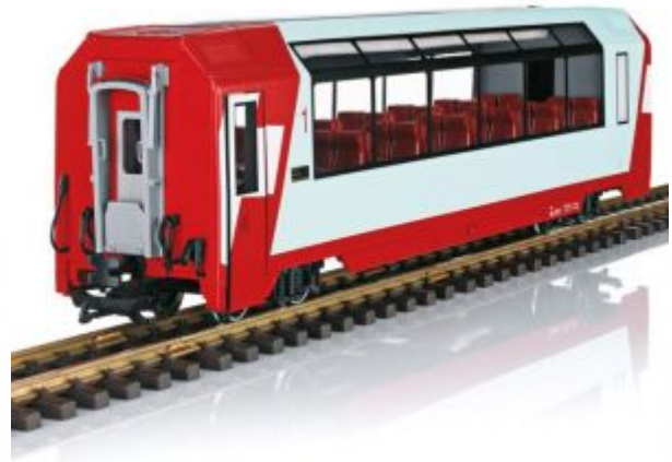
LGB 33666 Panoramawagen GEX 1.Kl.RhB