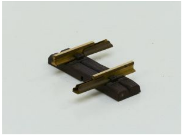
LGB 10040 Gerades Gleis, 41mm