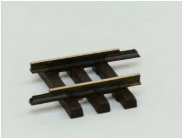
LGB 10070 Gerades Gleis, 75mm