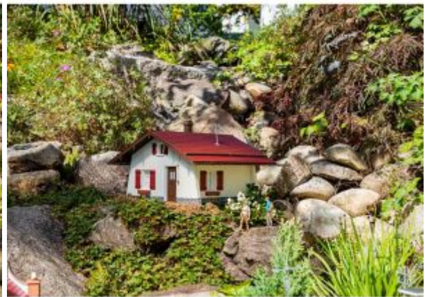
POLA 331053 Berghaus

Speciale prijs € 135,95 Normale prijs € 164,25