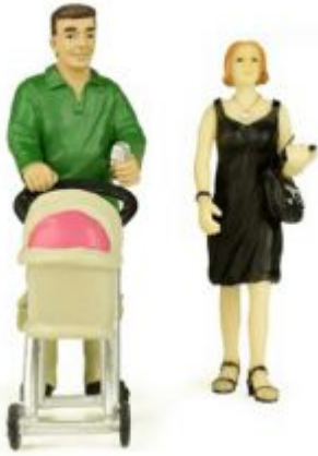
Scenecraft 22-173 Shopping People