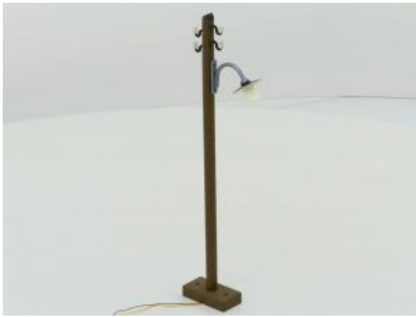
POLA 330970 STRAATLANTAARN G