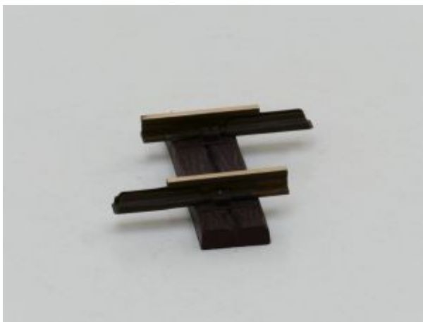
LGB 10040 Gerades Gleis, 41mm