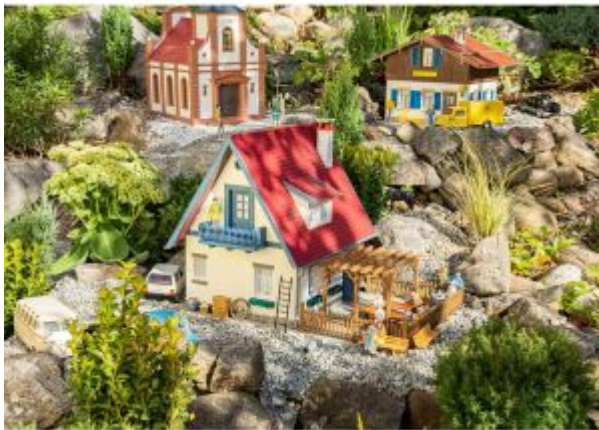
POLA 331084 Einfamilienhaus mit Pergola