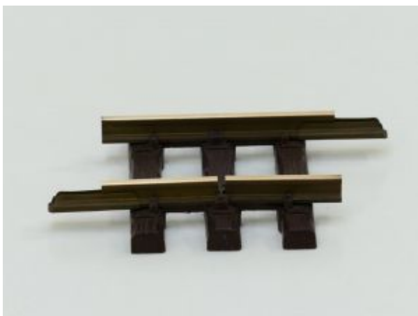
LGB 1008 W Ger. Unterbrechergleis,