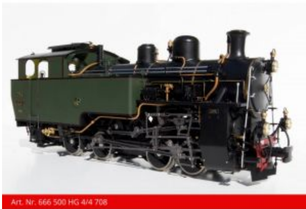
Kiss 666 500 HG 4/4 Zahnrad- Dampflokomotive | 708