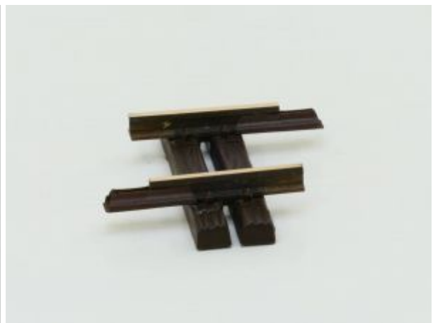
LGB 10050 Gerades Gleis, 52mm