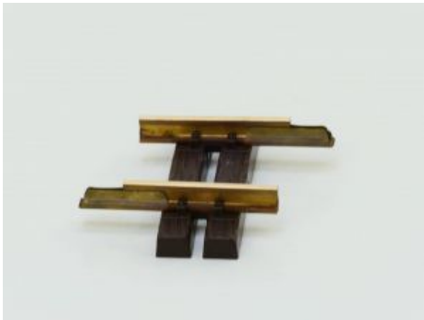
LGB 10050 Gerades Gleis, 52mm