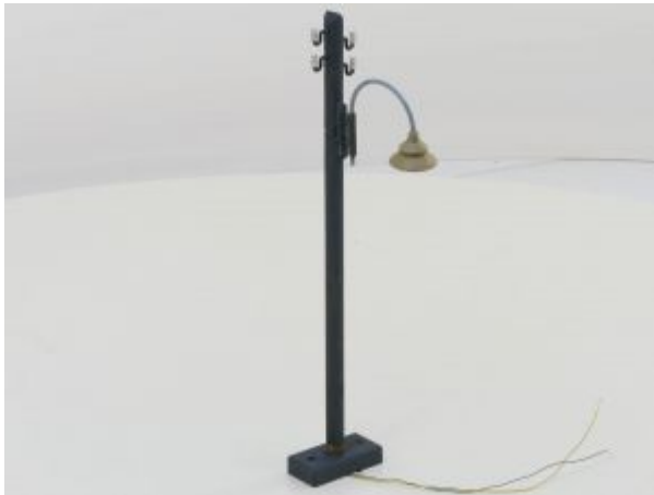
POLA 330970 STRAATLANTAARN G Beschilderd, Afwijkende lamp